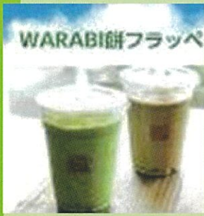
ドリンクinわらび餅

今や、年間を通じて人気のわらび餅。 季節を問わず、定番のお菓子となりました。 冷凍のわらび餅の使用で、アレンジも多種多様。 昔では考えられなかった組合せが増加しています。